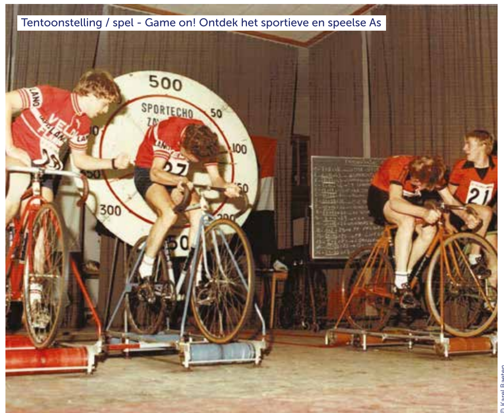
Tentoonstelling / spel - Game on! Ontdek het sportieve en speelse As

Duik op Erfgoeddag in de rijke geschiedenis van enkele sportverenigingen in As. Snuister in de Sint-Aldegondiskerk door een bijzondere collectie van historische foto's en nostalgische objecten, die het Asserse sportleven van vroeger doen herleven. Ben je op zoek naar meer actie? Speel dan verschillende oude volks- en kermissspelen. Een primeur! In de aanloop naar Erfgoeddag daagde de gemeente As alle jongeren uit om hun gemeente na te bouwen in het populaire game 'Minecraft'. Bewonder de creatieve resultaten in de Sint-Aldegondiskerk. Wil je zelf een videogame spelen? Neem dan plaats achter de retro game-console en herontdek klassieke games.