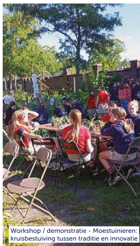
Workshop / demonstratie - Moestuiniëren: kruisbestuiving tussen traditie en innovatie

Waar? Pluktuin Vlakveld Hoogstraat 126, 3600 Genk Wanneer? Van 14 tot 16 u. Organisatie: Pluktuin Vlakveld i.s.m. Chiro, Natuurpunt en naturalfarming.be