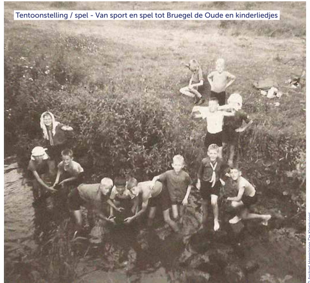
Tentoonstelling / spel - Van sport en spel tot Bruegel de Oude en kinderliedjes

Ga op zoek naar een verborgen speeldoos, maak kennis met oude en nieuwe hooren voelspelen of bewandel het voelpad.